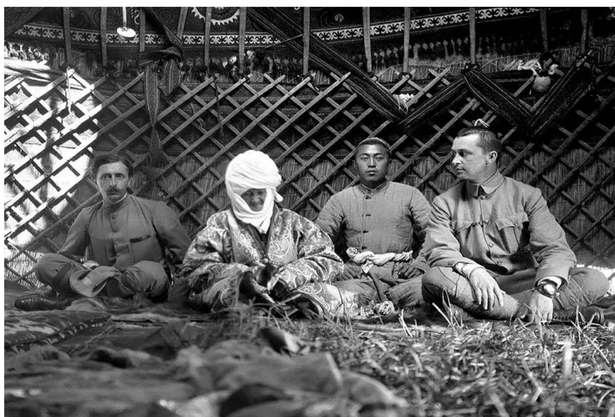
Орус армиясынын офицери К.-Г. Маннергейм жана атактуу француз ориенталисти Поль Пелльо Курманжан-датканын боз үйлөрүнүн биринде. Болжолу, 1906-ж. Алай

келип чыгышы жана эволюциясы боюнча алгачкы изилдөөлөрдү жана илимий тыянактарды XIX к. экинчи жарымында Н.Н.Харузин ишке ашырган. Автор көчмөндөрдүн кийиз үйү конус образдуу “чумдан” өнүгүп чыккандыгын, бүктөөгө жана жазууга боло турган тор көздүү кереге боз үй (кийиз үй) катары XVIII к. чегинде калыптанган деген пикирин ногойлордун кийиз үйүнүн келип чыгышына байланыштырган пикирин айткан (Харузин, 1896: 21). Н.Н.Харузиндин изилдөөлөрү өз доорундагы мыкты эмгектерден болуп саналат. Тилекке каршы илимпоз боз үйдүн генезисине терең көңүл бөлө алган эмес (Вайнштейн, 1976: 42). С.И.Вайнштейн “колдо болгон маалыматтарга таянсак, Чыгыш Европа жана ага чектеш аймактарды байырлаган сактар (скифтер) жана аларга чейинки жашаган башка уруулар конус образдуу (пирамида тибинде), учу шуштугуй келген жүктөмө үйлөр же төрт дөңгөлөктүү арабалардын үстүнө курулган кепелерде жашашкан” – деген ынанымдуу көз карашын жазган