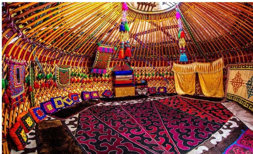
Кыргыз боз үйүнүн ички жасалгасы

негизге жакын жана көпчүлүк адис-илимпоздордун колдоосуна ээ болуп келет.