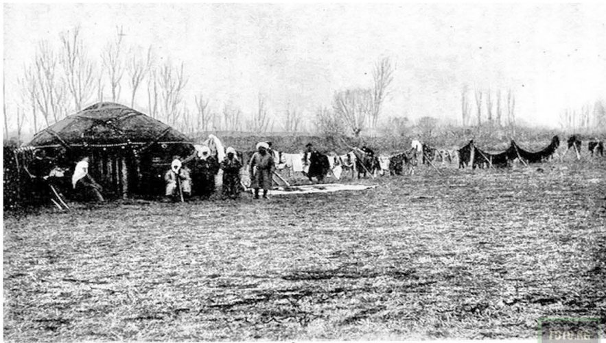
Курбангь-Джангь-датха показывасть вывешенное приданое своей внучки.

айланган. Бул каада Биринчи Түрк каганаты кулап, экиге ажыраганда (Батыш жана Чыгыш Түрк каганаттары, 581-659 жж.) да улантыла берилген, түрк кагандары өздөрүнүн баштапкы генеалогиялык тегин, Бөрүнүн (карышкыр) культун дайыма эстеп, белгилеп турушкан. Кытай жазма булактары: "...Каган ар дайым Дугинь тоосунда жашайт. Анын кагандык өргөөсүнүн оозу (эшиги) ыйык эсептелген күн чыгыш тарапка каратылып орнотулган. Каган жыл сайын өз кызматкерлери менен биргеликте бабаларынын үңкүрүнө атайын курмандыктарды чалат. Бешинчи айдын орто декадасында элдин баарын жыйнап, дарыя боюнда Көк Теңирге багышталган курмандык чалдыртат (Бичурин, 1950:230-231). Чыгыш түрктөрүндө болсо каган жана гуй-жэн (тектүү адамдар) жыйналышып бабалардын арбагына, бешинчи айда