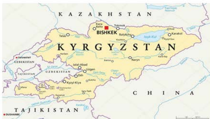
2-сүрөт. Кыргызстандын картасы.

Түштүктөгү ири шаарлардын ичинен Жалал-Абад шаары да, Баткен шаары да, Ош шаары да бул чен-өлчөмдөргө туура келбейт. Анткени Баткен шаары географиялык курчоодо турат, ал эми Ош жана Жалал-Абад шаарлары чек арага өтө эле жакын. Жогорудагы эки чен-өлчөмгө тең туура келе турган жерлер болуп Алай районунун Гүлчө шаарчасы жана Токтогул районунун Токтогул шаарчасы эсептелет (2-сүрөт).