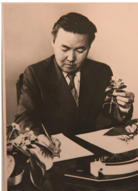
Исследования жароустойчивости растений