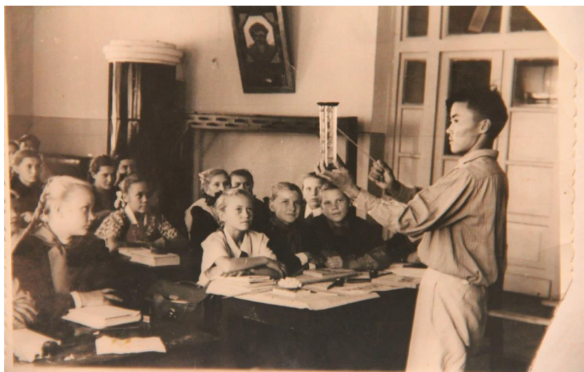
Педагогическая практика в средней школе

Каждый человек когда-то должен посадить хоть одно дерево. Мой отец посадил целый сад. Светлая ему память.