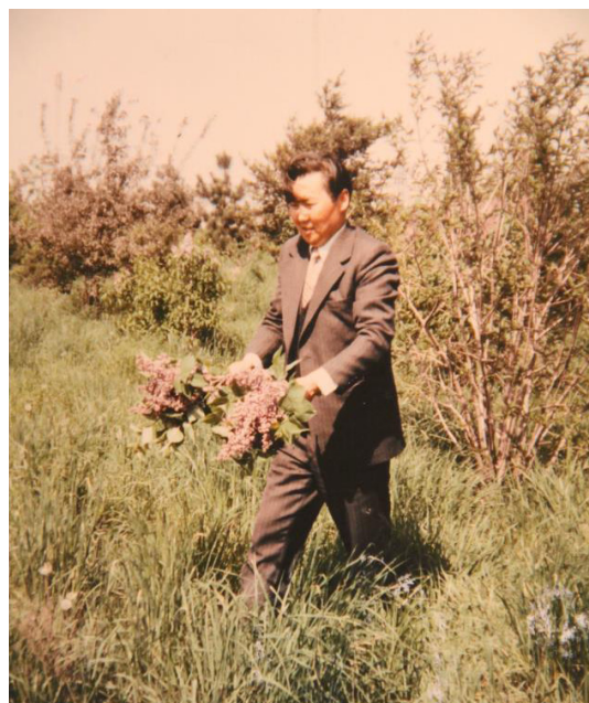
В ботаническом саду с букетами сирени