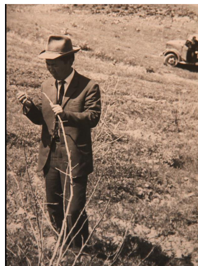
Исследования адаптации древесных растений к засухе в предгорьях Кыргызского Ала-Тоо