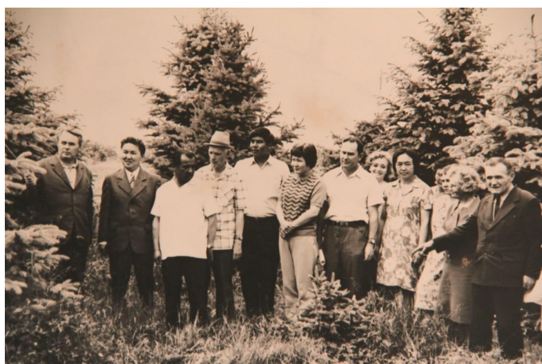
С сотрудниками ботанического сада